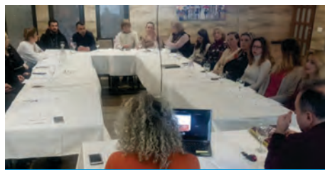
Прва Јавна дебата за презентирање на наодите од спроведениот мониторинг