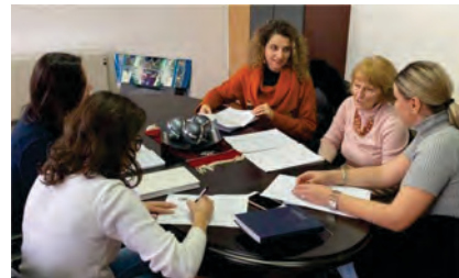
Интервјуа согласно изготвената методологија со претставници на Сектор за финансии

Исто така беше спроведена и кампања за социјални медиуми, за споделување на наодите од мониторингот која допре и опфати најмалку 20.000 луѓе.