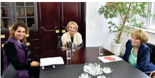
Средба за претставување на изготвената методологија за следење со градоначалничката на општина Тетово

На овој начин континуирано се следеа напредокот во реализацијата на проектот во однос на планот и постигнувањето на планираните резултати на проектот. Евалуацијата даде оценка колку добро е спроведен проектот и кое е влијанието и промените што се постигнаа со проектот.