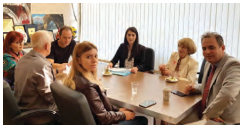
Интервјуа согласно изготвената методологија за следење со претставници на Сектор на јавни дејности