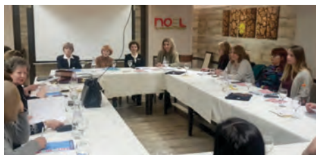
Втора Јавна дебата за презентирање на наодите од спроведениот мониторинг