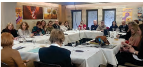
Втора Јавна дебата за презентирање на наодите од спроведениот мониторинг